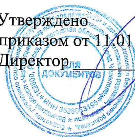
График приема и посещения детей лицами, желающими усыновить (удочерить) или принять под опеку ребенка (попечительство) на 2021 год