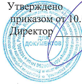
График приема и посещения детей лицами, желающими усыновить (удочерить) или принять под опеку ребенка (попечительство) на 2022 год